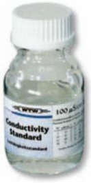
Etalon de conductivité 100 \mu\text{S}/\text{cm}