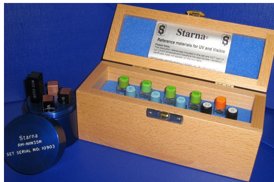
Coffret Etalon Certifier pour la validation des Spectrophotomètres