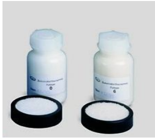
Far type, Couleur de Sucre de 0 à 6 certifier pour Saccaroflex